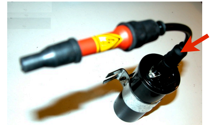
3 - Emboîter la partie mâle du «PROTECTOR» dans la bobine