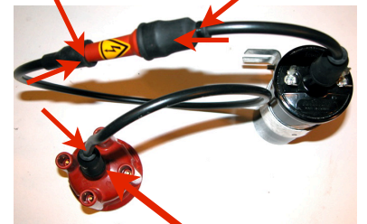
6 - Bien rebrancher le câble haute tension dans la tête d'allumeur

à la fin appuyer des deux côtés afin de contrôler le bon emboîtement des câbles