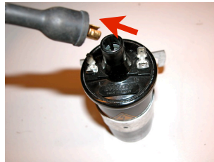
2 - Enlever votre câble haute tension de la bobine