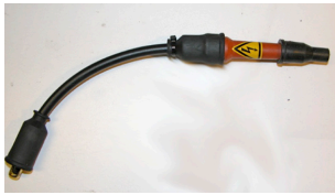
1 - Le «PROTECTOR» tel qu'il est livré